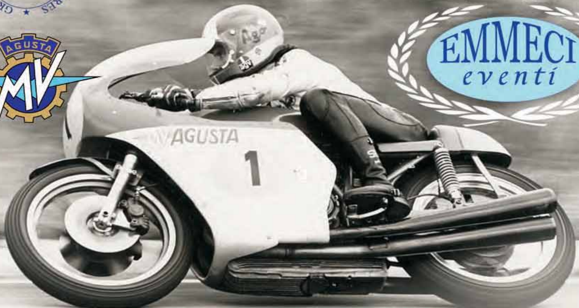
Giacomo Agostini 15 volte Campione del Mondo