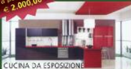
CUCINA DA ESPOSIZIONE