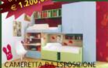
CAMERETTA DA ESPOSIZIONE